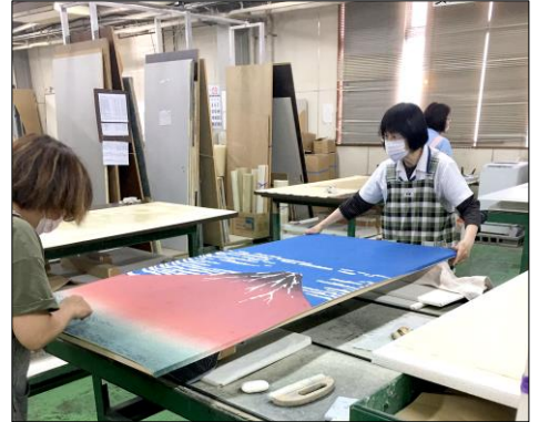
紙：株式会社利久 富嶽三十六景 NO.33 凱風快晴