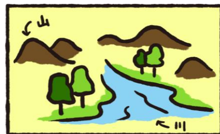
山水柄：山・川など自然美をテーマとする柄 代表的な襦紙「柄」の一つ

質商品がガンガン売れていく。羨ましいことこの上ない。そんなところに「中国人が山水柄の織物襦紙を爆買いしている!」という一報が入った。「襦紙、山水、糸入り、何千枚でもあるだけすぐ欲しい、現金で払う!」と、まくしたてるような注文だったそうだ。ある情報筋によれば、年間で10,000枚以上の襦紙が海を渡っているらしい。この業界にも、