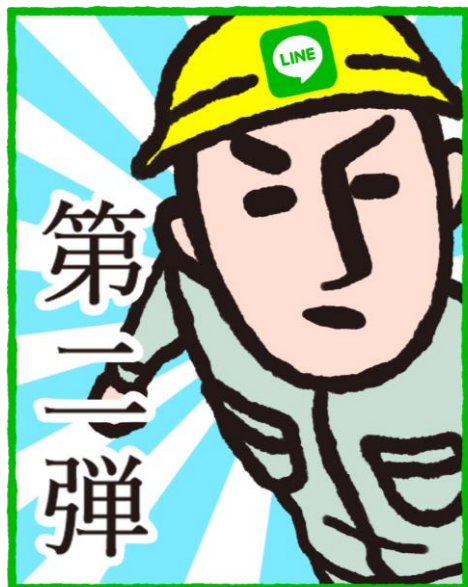
LINEスタンプ 第2弾 登場!

TEL : 047-368-2511 / FAX : 047-368-0204 / URL : http://www.harima-sangyou.co.jp/